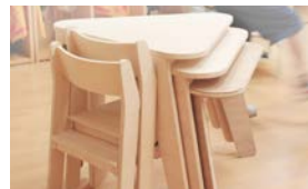
O-musubi Miyuki Uchida