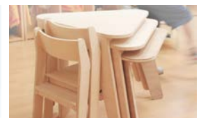
O-musubi Miyuki Uchida