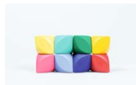
Vulpi - Magnetic Toys Tobias Thomas