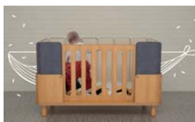
Franca / crib&bed Natalia Campos